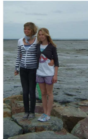
ohne Worte 😊