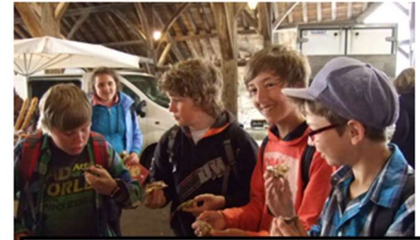
Austernprobe auf dem Markt